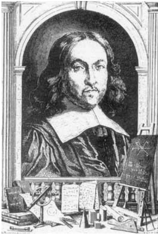
Abbildung 6.5. Pierre de Fermat

Primzahlen sind wichtig, da wir aus ihnen alle positiven ganzen Zahlen bilden können. Es zeigt sich jedoch, dass sie auch eine Menge weiterer, oft überraschender Eigenschaften besitzen. Eine davon wurde durch den französischen Mathematiker Pierre de Fermat (1601–1655) entdeckt. Sie wird heute der „kleine“ Satz von Fermat genannt.