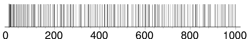
Abbildung 6.2. Ein Strich-Diagramm der Primzahlen bis 1000.

als Produkt zweier kleinerer natürlicher Zahlen, etc.. Früher oder später haben wir nur noch Primzahlen. Die alten Griechen kannten (und bewiesen!) bereits eine schöne Eigenschaft dieser Darstellungsform, nämlich ihre Eindeutigkeit . Das bedeutet, es gibt keine weitere Möglichkeit, eine natürliche Zahl n als Produkt von Primzahlen aufzuschreiben (natürlich ausgenommen, wir multiplizieren die Primzahlen in einer anderen Reihenfolge). Es bedarf einiger Raffinesse, dies zu beweisen (wie wir im nächsten Abschnitt sehen werden) und zu erkennen, dass ein solches Resultat wichtig ist, war schon eine große Leistung. All das ist jedoch bereits mehr als 2000 Jahre her!