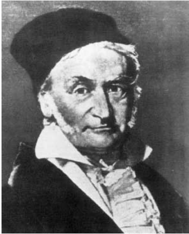
Abbildung 6.6. Carl Friedrich Gauss (1777–1855)

führen. Einer dieser wichtigen Schritte war getan, als Carl Friedrich Gauss feststellte, dass der Ausdruck „ a und b besitzen bei der Division durch m denselben Rest“ sehr häufig verwendet wird und sich diese Relation recht ähnlich zur Gleichheit verhält. Er führte dafür eine Bezeichnung ein, die Kongruenz .