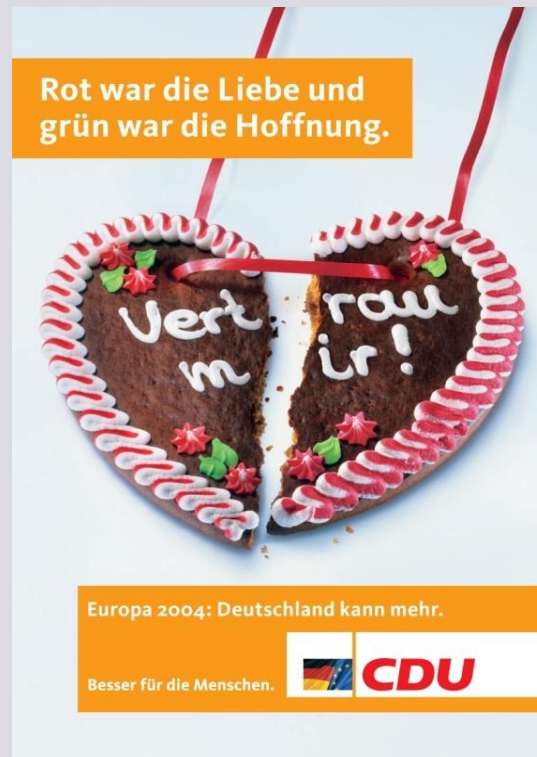
Abbildung 1: Wahlplakat der CDU aus dem Europawahlkampf 2004 (CDU Bundesverband).