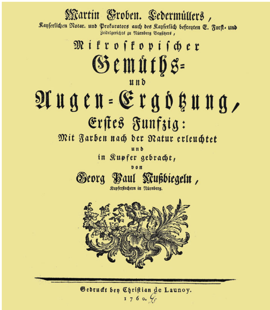
Abb. 1 Titelseite eines Naturbuches von 1760.