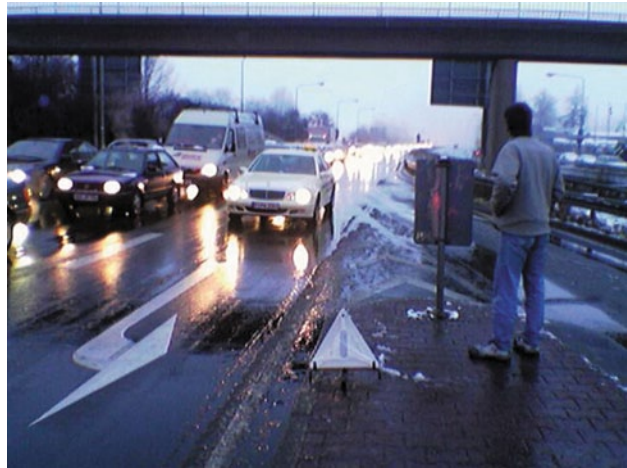
Abb. 2.6 Tägliches Bild: Berufsverkehr in Frankfurt

cken für den Berufsverkehr sowie mangelnder Service, überlastete Zugbegleiter und der Vorrang von Fernzügen der IC- und ICE-Klasse sorgen dafür, dass die Bahn im regionalen Bereich an das Auto Fahrgäste abgibt.