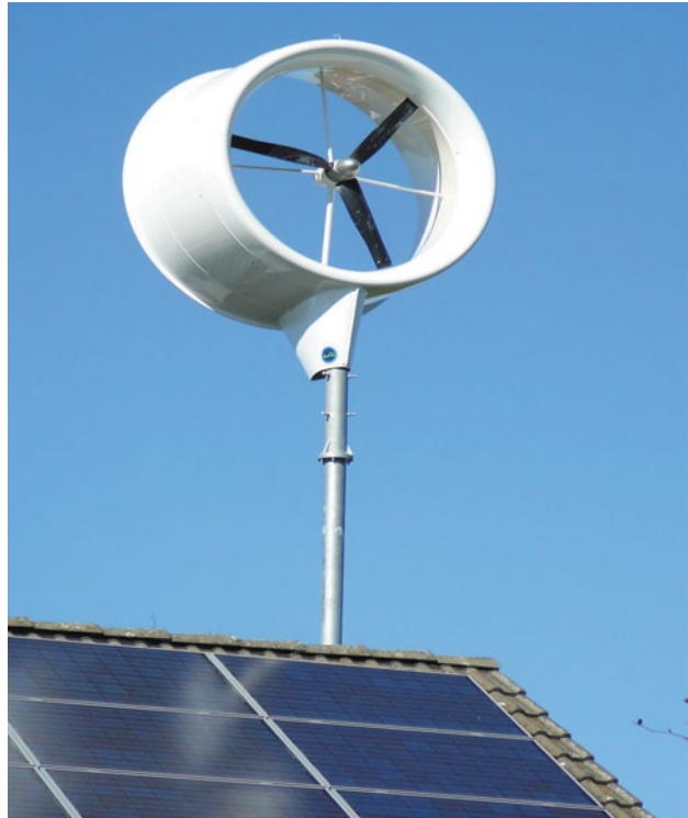
Abb. 2.7 Hybridanlage

Einige Teile des geheimen Deals kamen nur durch Zufall an das Tageslicht. Das Parlament bekam den Gesetzestext viel zu spät, und der Bundesrat wurde komplett ausgespart. Im Umweltausschuss durchlief das Gesetz den Ausschuss in Rekordzeit.