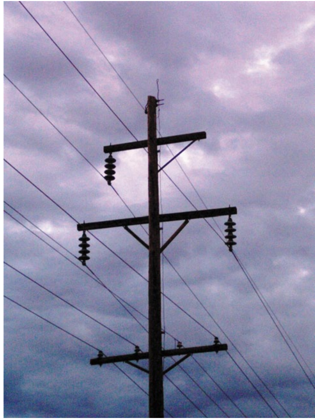
Abb. 2.3 Überlandleitungen auf Holzmasten

werden in Benzin-Motoren mit sehr schlechtem Wirkungsgrad endgültig und unwiderruflich verheizt.