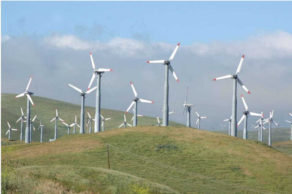
Abb. 2.2 Onshore-Windpark

Kleinwindanlagen produzieren zwar weniger Strom pro Windgeschwindigkeit als die tonnenschweren Großanlagen. Aber durch die Gesamtheit von vielen kleinen Einheiten entsteht in der Endsumme mehr Energie aus Windkraft.