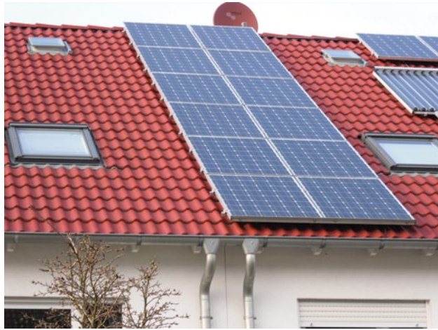
Abb. 2.4 Photovoltaik und Solarthermie auf einem Dach

Die Beschreibung von der Rechtslage vom Verbot für Nachtspeicheröfen ist genauso dürftig wie der überflüssige Hinweis auf das Widerrufsrecht für Haustürgeschäfte. Vermutlich gab es einen einzelnen Fall, den die Verbraucherzentrale dann als „Empfehlung“ für alle Direktstrahler abgegeben hat.