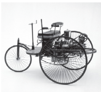
Motorwagen. Carl Benz 1886