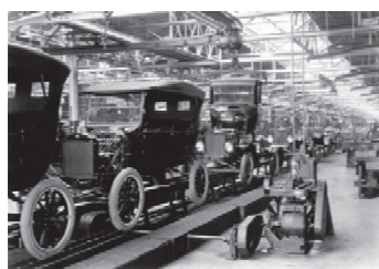
Fließproduktion des Model-T, ab 1913