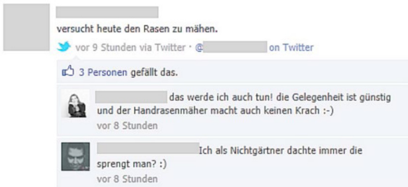
Abbildung 2: Facebookbeitrag von Frau K.

Quelle: Siri, Melchner & Wolff (2012, S. 14)