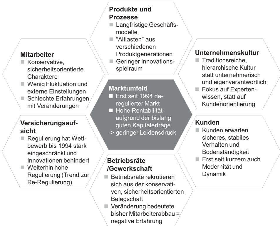
Abb. 2.2 Faktoren der Veränderungsaversion der deutschen Assekuranz

Prozessmodelle werden in den großen Versicherungsunternehmen etabliert und Kunden- und Serviceorientierung wird zum zentralen Wettbewerbsfaktor. Auch der Vormarsch von „Big Data“ wird die Versicherung nachhaltig verändern (vgl. Heslop 2014). Die angestauten Hierarchien werden flacher und dies zeigt sich auch zunehmend in mehr Freiheit aber auch mehr Verantwortung für den Einzelnen durch Home-Office Lösungen, Open Space Büros etc.. Ebenso bedeutet dies aber auch, dass die Unternehmen mit der Förderung von Selbstverantwortung lernen müssen, Kontrollverluste zu ertragen, wofür aber eine positive und fehlertolerante Firmenkultur nötig ist. Die Konzentration auf Prozesse und Projekte wird in der Branche aktiv vorangetrieben und fasst langsam, zum Beispiel in Form von Prozessmodellen Fuß. Auf diesem Gebiet sollte aber auch eine Ausbildung der Belegschaften erfolgen, um die Eigenverantwortung weiter zu fördern und eine breite Basis an Know-how aufzubauen, die diese Veränderungen verstehen und unterstützen.