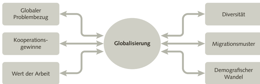
Abbildung 2: Arbeitskultur 2020 – Anforderungen der Globalisierung

Die Arbeitskultur 2020 wird sich daher auch in Deutschland durch ein größeres Maß, an Diversität der Belegschaften auszeichnen (müssen). Hierbei geht es nicht allein um eine größere Vielfalt primärer demografischer Merkmale (z. B. Alter und Geschlecht), sondern im Wesentlichen auch um eine Differenzierung von kulturellen und kompetenzbezogenen Hintergründen und Motiven. Eine derartige Veränderung hat Folgen für Kooperationsprozesse in Teams, Anforderungen an interaktive Personalführung und Ausgestaltung von Personal- beziehungsweise Anreizsystemen. Diese veränderte Zusammensetzung von Belegschaften erfordert auch vielseitige und vielschichtige Anpassungsprozesse, die sich auf unterschiedliche Dimensionen der Arbeits- und Unternehmenskultur beziehen. In jedem Fall folgt hieraus für die Arbeitskultur, in einem Zuwachs an Diversität nicht nur einen Lückenschluss zur Abdeckung von fehlenden Personalkapazitäten zu sehen, sondern den Kompetenzzuwachs durch Diversität zu schätzen. Die Arbeitskultur 2020 wird somit eine Herausforderung der Differenzierung zwischen und der Integration von Kompetenzen, Erwartungen und Zielen bestehen müssen.