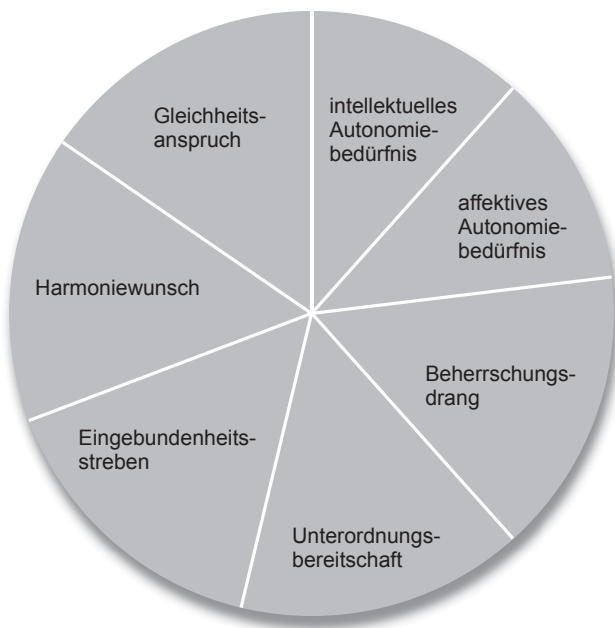
Abb. 2.1 Die von Shalom Schwartz postulierte Wertestruktur

weise auch den benachbarten Werten zumindest teilweise zustimmen. Wenn eine Gesellschaft also zum Beispiel durch hohen Gleichheitsanspruch gekennzeichnet ist, so ist es wahrscheinlich, dass ihre Mitglieder auch ein großes Autonomiebedürfnis und einen großen Harmoniewunsch haben. Benachbarte Werte passen recht gut zusammen, einander gegenüberliegende schließen sich eher aus.