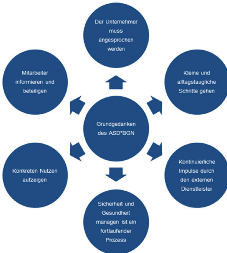
Abb. 2.2 Grundgedanken des ASD*BGN

Aus Sicht des ASD*BGN sind die in Abb. 2.2 dargestellten Grundgedanken unverzichtbar für das Gelingen eines BSGM. Der Unternehmer ist und bleibt der zentrale