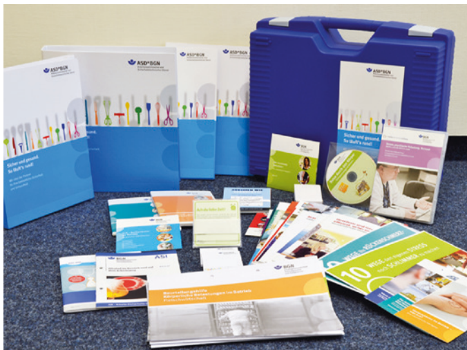
Abb. 2.3 Toolbox

Der eingängige Arbeitstitel der Toolbox lautet „Sicher und gesund. So läuft's rund!“. Hierfür wurde eigens auch ein Logo entwickelt, um für das Thema einen Wiedererkennungseffekt in den Betrieben zu schaffen (siehe Abb. 2.3). In den Seminaren zeigte