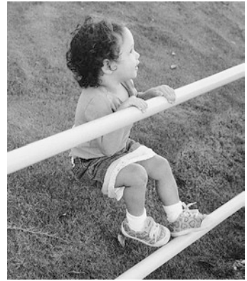
■ Abb. 2.9 Im 2. Lebensjahr nimmt das Kind sich selbst wahr und entwickelt ein Unabhängigkeitsgefühl

Ein Kind, das sich seinem 2. Geburtstag nähert, glaubt, sein Leben selbst bestimmen zu können, und lässt die anderen das wissen. Mit dem Wort »Nein« drückt es seine neu entdeckte Unabhängigkeit aus (■ Abb. 2.9). Das kann für die Eltern frustrierend sein, aber es ist ein wichtiger Baustein in der Entwicklung sozialer Kompetenzen. Es braucht viel Geduld und Verständnis, um den Widerstand des Kindes gegen die Wünsche der Eltern gutheißen zu können.