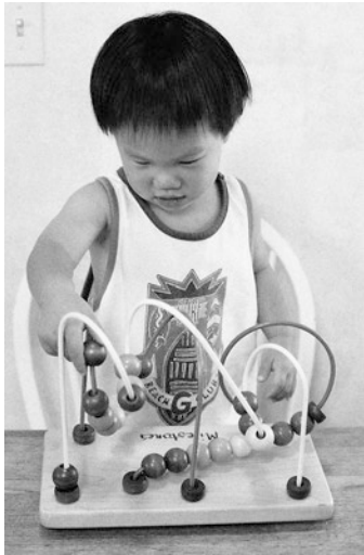
■ Abb. 2.8 Im 2. Lebensjahr ermöglichen Tastinformationen dem Kind, seine Hände immer präziser zu bewegen

Lokalisieren von Berührungen Die Fähigkeit, Bewegungen zu planen, hängt von der Genauigkeit des Berührungssinns ab. Das Neugeborene nimmt bereits wahr, ob es berührt wird, und Berührungen können seine Gefühlslage beeinflussen; aber es kann nicht orten, wo es berührt wird. Als Reaktion auf die Berührung bewegt es seinen Kopf, aber dies ist eine automatische Reaktion und keine willkürliche Aktion. Im 2. Lebensjahr kann das Kleinkind nun grob sagen, wo es berührt wird, und es kann seine Reaktionen auf die Berührung willkürlich steuern.