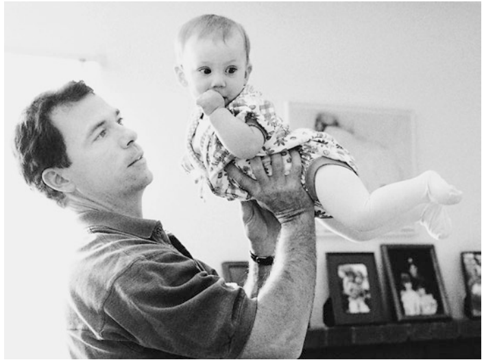
■ Abb. 2.4 Mit rund 6 Monaten streckt sich das Baby automatisch gegen die Schwerkraft und orientiert seinen Kopf und seinen Körper im Raum

zu tun, die es planen muss. Für jede neue Spielaktivität ist mehr Bewegungsplanung und mehr sensorische Integration nötig. Das Kind kann jetzt auch für kurze Zeit frei sitzen, ohne umzufallen. Die automatischen muskulären Reaktionen, die es aufrecht halten, werden von den Schwerkraft-, Bewegungs- und Seheindrücken gesteuert.