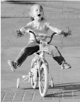
■ Abb. 2.1 Um auf einem Fahrrad die Balance halten zu können, muss ein Kind den Zug der Schwerkraft und seine eigenen Körperbewegungen wahrnehmen können