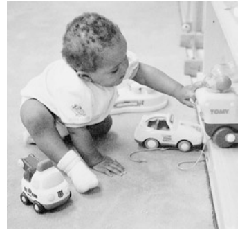
■ Abb. 2.6 Gegen Ende des 1. Lebensjahres verfeinert das Kind spielerisch seine Koordination und Handgeschicklichkeit

In dieser Periode lernt das Kind zu gehen, zu sprechen und komplexere Handlungen zu planen und erfolgreich auszuführen. Mit Sicherheit wäre es für das Kind sehr schwierig, diese Dinge zu lernen, wenn es nicht während des 1. Lebensjahres schon unzählige sensorische Informationen verarbeitet und integriert hätte. Und ohne die Integration, die im 2. Lebensjahr stattfindet, wäre wiederum die weitere Entwicklung schwierig.