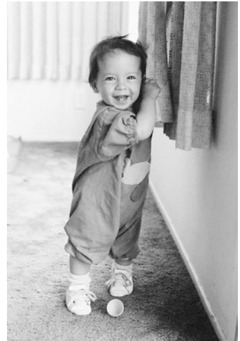
■ Abb. 2.7 Eines der größten Ereignisse der frühen Kindheit ist das freie Stehen und Gehen. Das Kind überwindet die Schwerkraft – eine großartige Leistung, die sein Selbstvertrauen stärkt