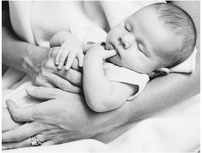
■ Abb. 2.2 Die fürsorglichen Berührungen und rhythmischen Bewegungen der Bezugsperson sind grundlegend für die Entwicklung des Säuglings

diese angeborenen Reaktionen automatisch sind, muss das kindliche Gehirn die entsprechenden Sinnesreize integrieren, damit die Reaktion überhaupt ausgelöst wird.