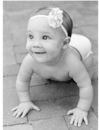
■ Abb. 2.5 Wenn das 8-monatige Kind von einem Ort zum anderen krabbelt, macht es Erfahrungen mit dem Raum und lernt, sich im Raum zu orientieren

Finger und Augen (Visuomotorik) Das Kind kann nun Daumen und Zeigefinger für den Zangen- oder Pinzettengriff benutzen, um kleine Dinge aufzuheben oder an einer Schnur zu ziehen. Es steckt seinen Zeigefinger gerne in Löcher. Die Tastempfindungen und die Informationen