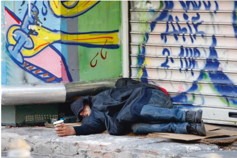
Abb. 2 „Ein Obdachloser in Athen.“

Hand des Liegenden zeigt einen gelbfarbigen Unterarm, die zugehörige Hand umfasst eine blaue Spritze.