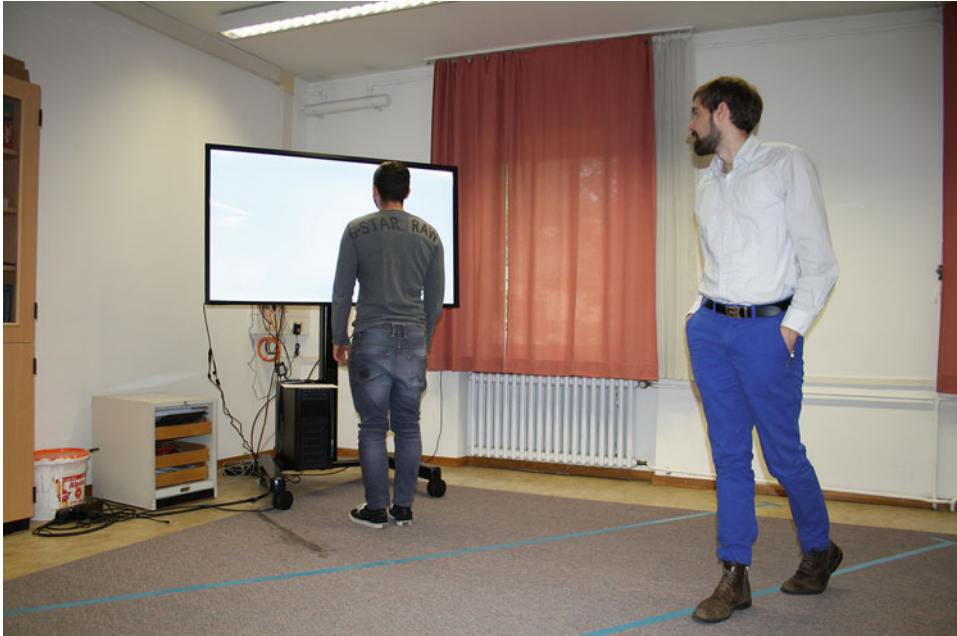
Abb. 2.4 Laborexperiment zur Ermittlung der optimalen Textanimationsrichtung [13]

Erkenntnisse dazu, dass animierte Darstellungen helfen, die Aufmerksamkeit von Benutzern auf den Bildschirm zu ziehen oder zu vergrößern [19].