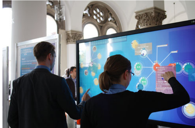
Abb. 2.2 Einsatz von CommunityMirrors als Informationsstrahler im halb-öffentlichen Raum – während der Tagung MuC 2014 an der LMU in München

Querschnittsthemen betrachtet: Mehrbenutzerfähigkeit, Walk-up-and-use-Fähigkeit, und Joy-of-use.